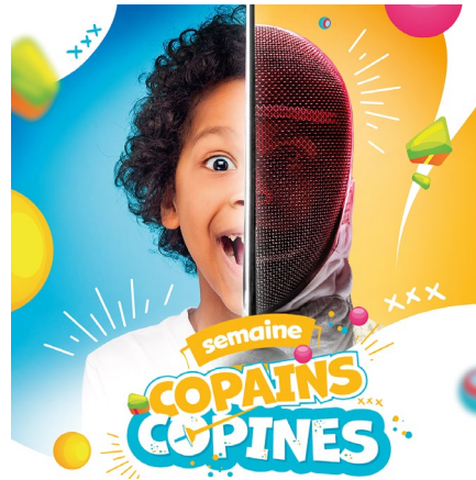
Visuel réseaux sociaux

Pensez à communiquer sur vos réseaux sociaux (Facebook, Instagram, Twitter... ) en utilisant les visuels proposés par la Fédération. Vous pouvez aussi proposer à vos licenciés de partager.